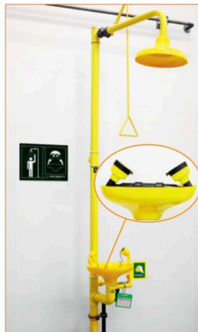
Ducha de emergencia y lavaojos.

Si se te incendia la ropa tiéndete en el suelo y rueda sobre ti mismo para apagar las llamas. No corras ni intentes llegar a la ducha de seguridad si no está muy cerca de ti. Si se le incendia la ropa a un compañero, no utilices un extintor para apagarla, lo más adecuado es cubrirle rápidamente con una manta ignífuga, conducirle hasta la ducha de seguridad si está cerca o hacerle rodar por el suelo.